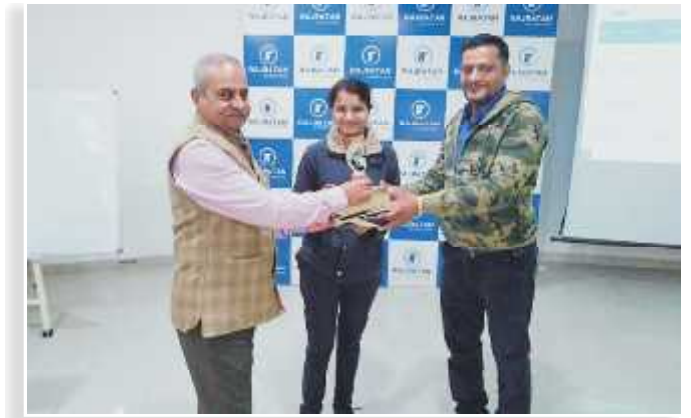
“SUBSTATION & PANEL ROOM” (SUPPORTING FUNCTION)