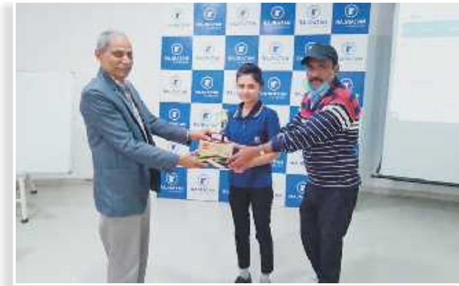
“WIRE DRAWING” (MANUFACTURING FUNCTION)