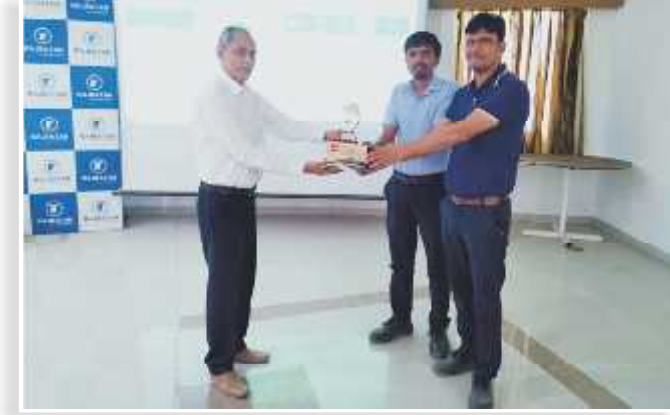
“PATENDING” (MANUFACTURING FUNCTION)