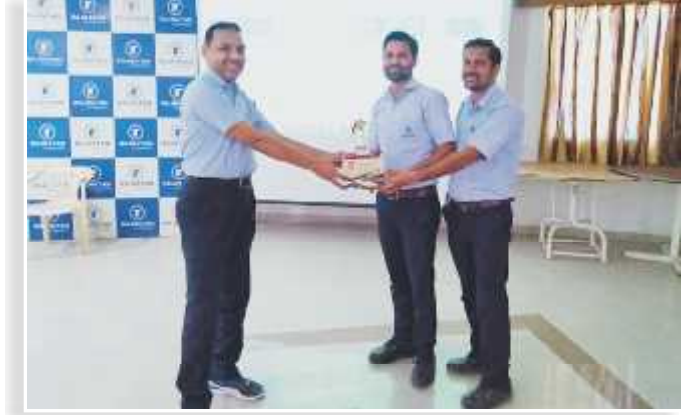
“UTILITY” (SUPPORTING FUNCTION)